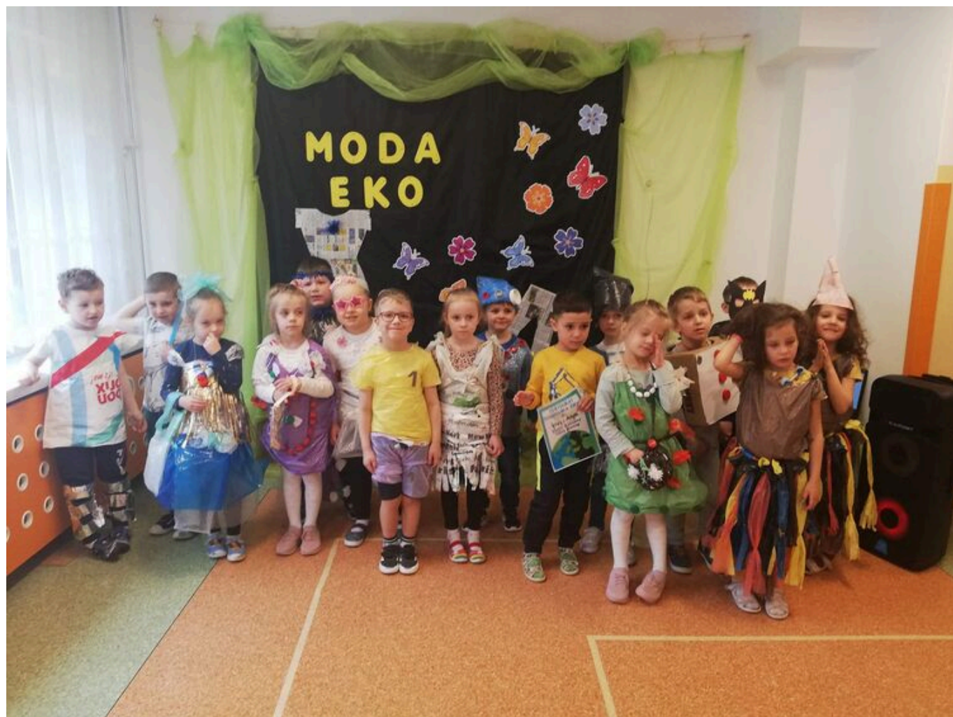
Eko - Pokaz Stokrotek.