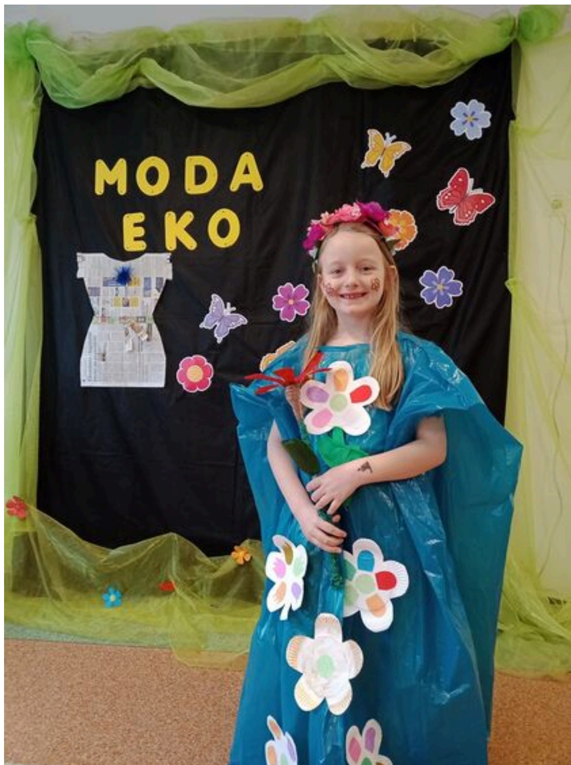
Eko - Pokaz Pajacyków.