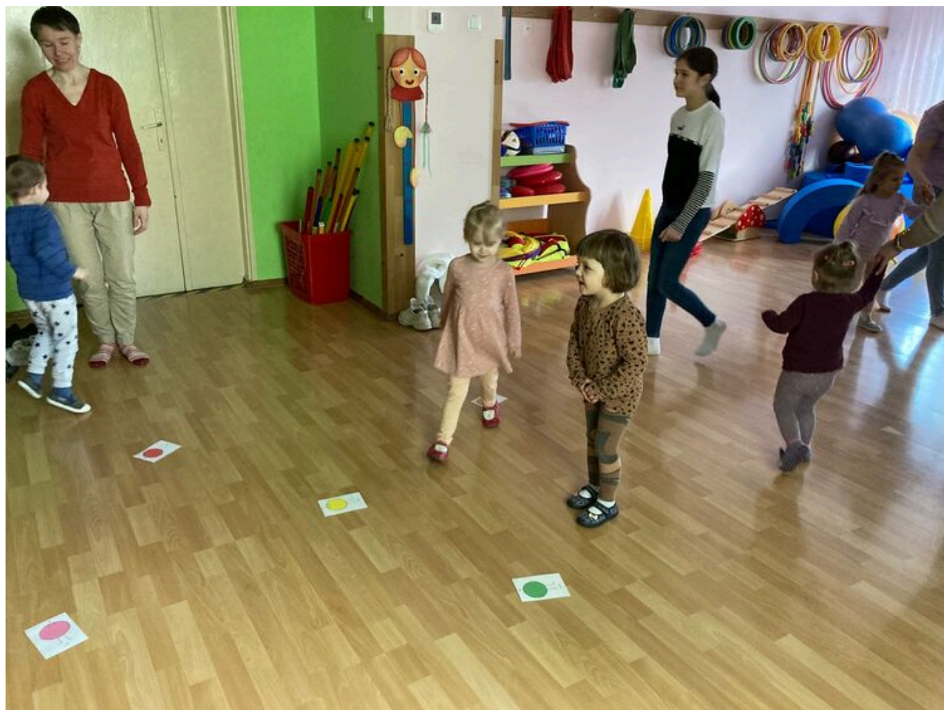
Drugie spotkanie - zabawy ruchowe i sensoplastyka.