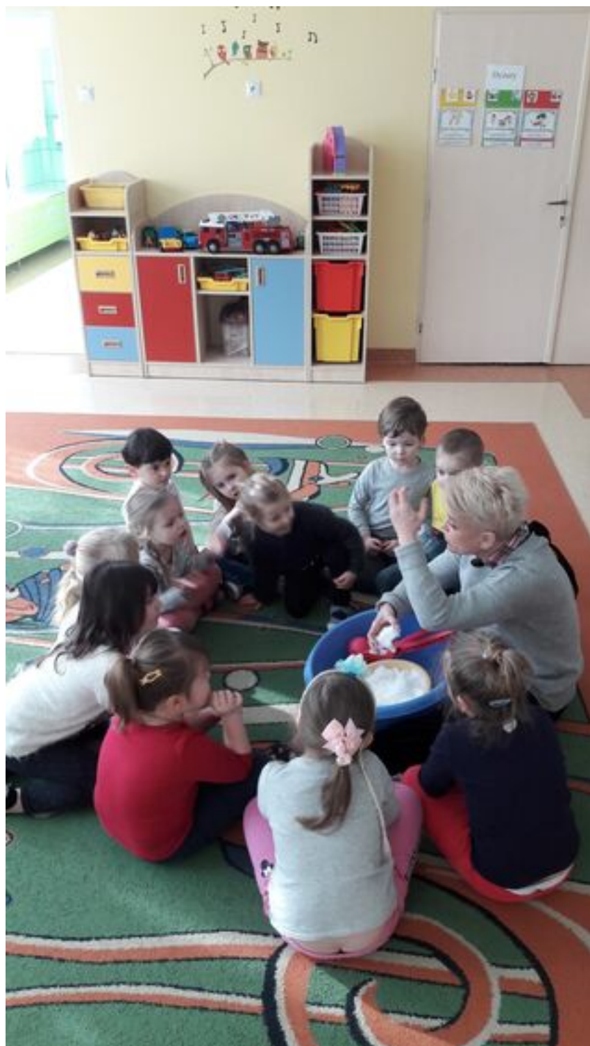
„Misiowa” podróż do Krainy Lodu”